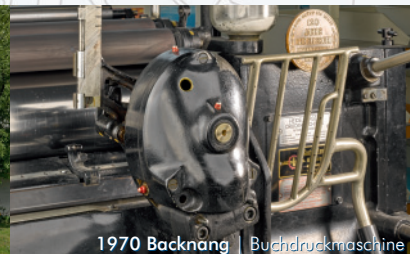
1970 Backnang | Buchdruckmaschine