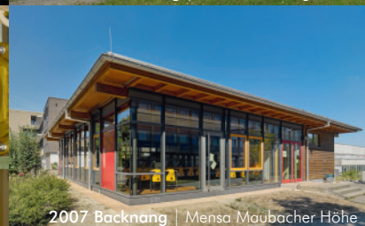
2007 Backnang | Mensa Maubacher Höhe