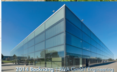
2014 Backnang | RIVA GmbH Engineering