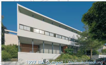
1927 IBA Stuttgart | Weißenhofsiedlung