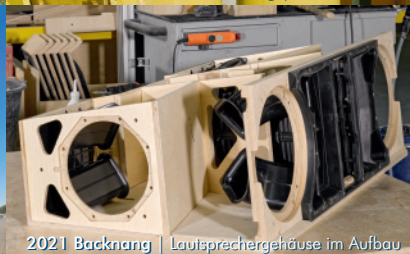
2021 Backnang | Lauisprechergehäuse im Aufbau