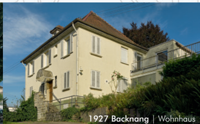
1927 Backnang | Wohnhaus