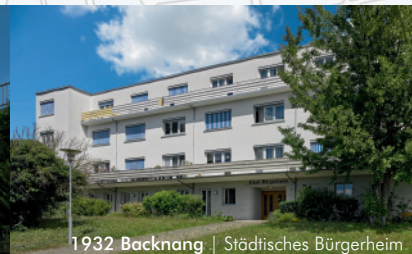
1932 Backnang | Städtisches Bürgerheim