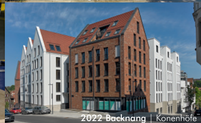
2022 Backnang | Koenenhöfe