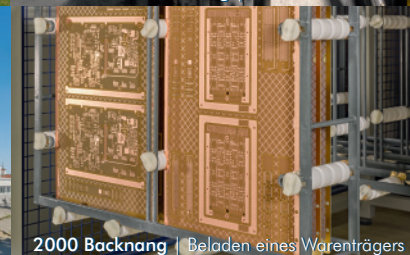
2000 Backnang | Beladen eines Warenträgers