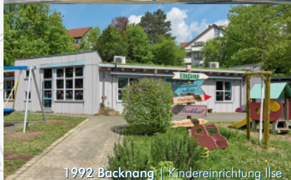
1992 Backnang | Kindereinrichtung Ilse