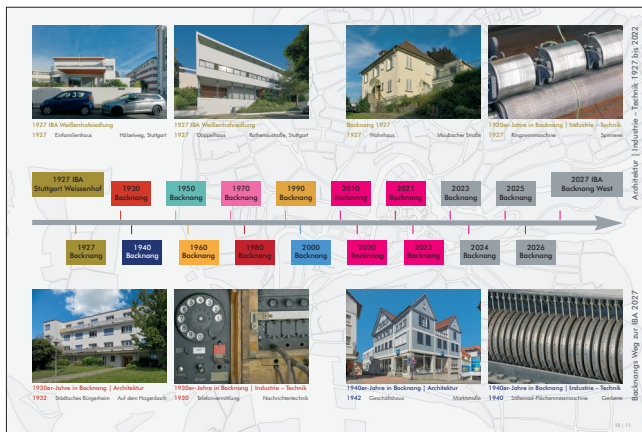
Backnangs Weg zur IBA 2027 – Architektur | Industrie 1927 bis 2022

Edition Lattner ISBN 978-3-947420-28-5 | Euro 27.-