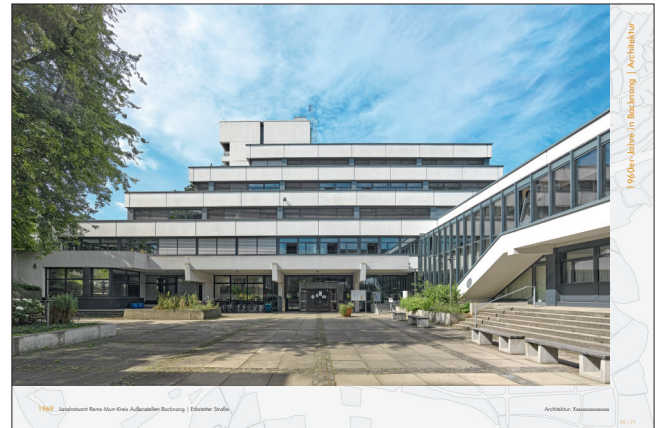
1969 Leibniz-Klinik Fern-Klinik Kufelsheim Backnang | Eilbacher Straße Architekt: Rosenbaum