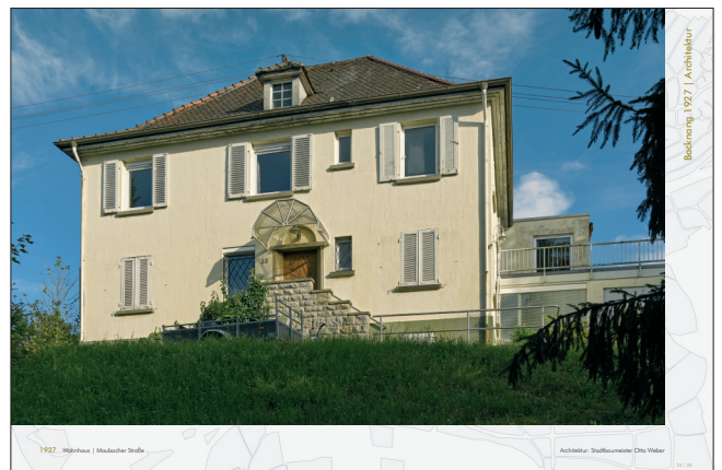
1927 Wohnhaus | Maubacher Straße, Backnang | Architektur