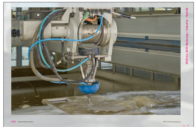
2020 bis 2022 Backnang | Industrie – Technik GfH GfH Engineering