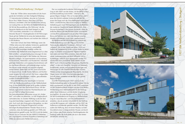
1927 Weißenhofsiedlung | Stuttgart