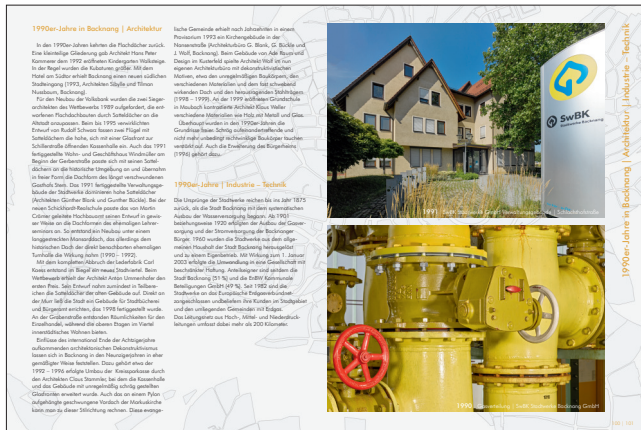
1990er-Jahre in Backnang | Industrie – Technik