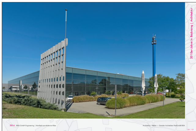
2014 GfH Engineering | Manfred-Kunze-Allee Architekt: Wölber + Grottel-Architekten Prof. Dr. GfH