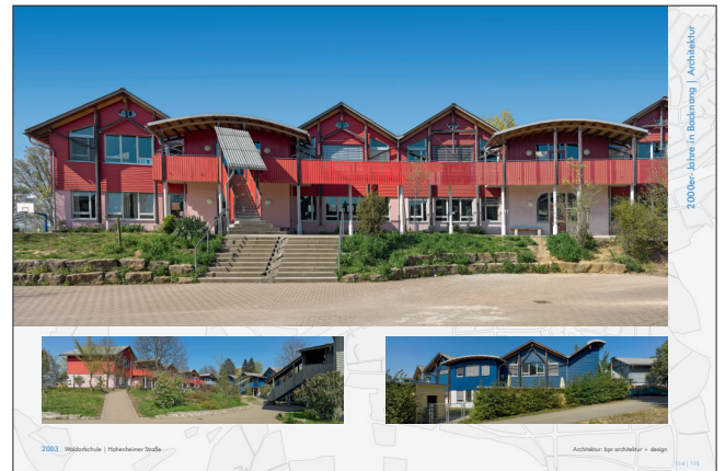
2000er-Jahre in Backnang | Architektur